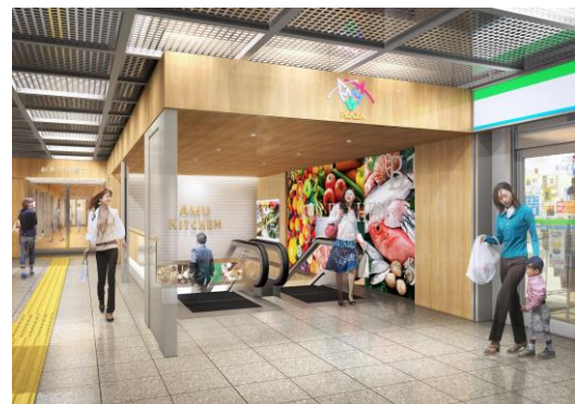
エントランスイメージ