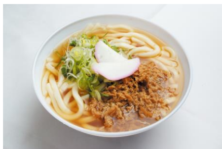
北九州駅弁当(かしわうどん)