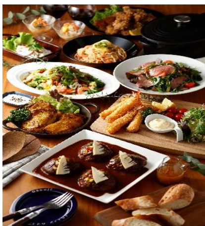
ヴィエント&テーブル(洋惣菜)