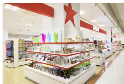
キャンドウ(100円ショップ)