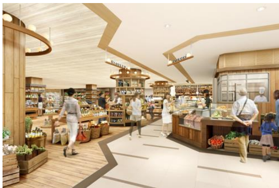
フロア内環境イメージ

毎日使える、毎日役立つ、便利で元気な駅ナカ市場をコンセプトに、駅をご利用の方に向けたデイリーマーケットとして、 スーパーマーケット「レッドキャベツ」・ドラッグストア「ココカラファイン」・惣菜/弁当「ミートデリカ静」「クックチャム」の全面改装 に加え、お客さまからご要望の多かった 100 円ショップ「キャンドウ」 、 店内で焼き上げたパンを 100 円で提供する「阪急ベーカリー」 が新規出店し、さらに利便性を高めてまいります。また、福岡市でも女性のお客さまに人気の高い、 玄米おむすび専門店「峠の玄氣屋」 が北九州初出店。地元からは、 手作り洋惣菜や日替わりのパスタ・薬膳スープを提供する新業態「ヴィエント&テーブル」 や、小倉駅ホームでおなじみの かしわうどん「北九州駅弁当」 が出店します。