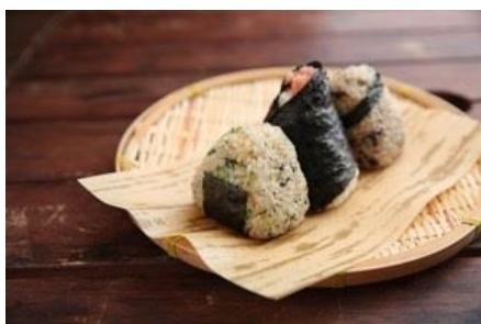
峠の玄氣屋(玄米おむすび)