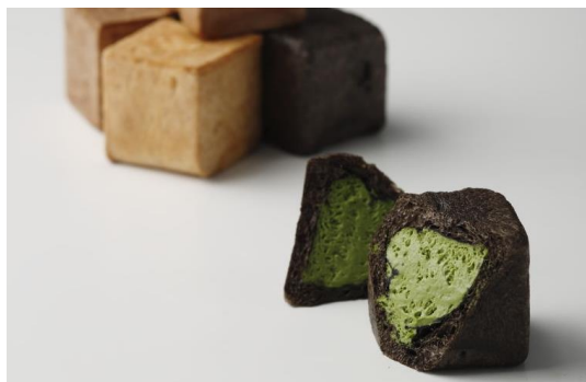
京都カカオ亭(京都)