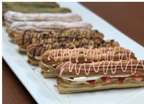
ステーションホテル小倉(北九州)