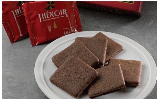
小樽洋菓子舗ルタオ(北海道)