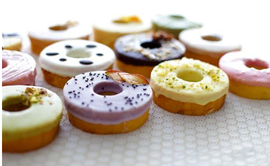
スイーツショップ ファボリプリュ(北九州)